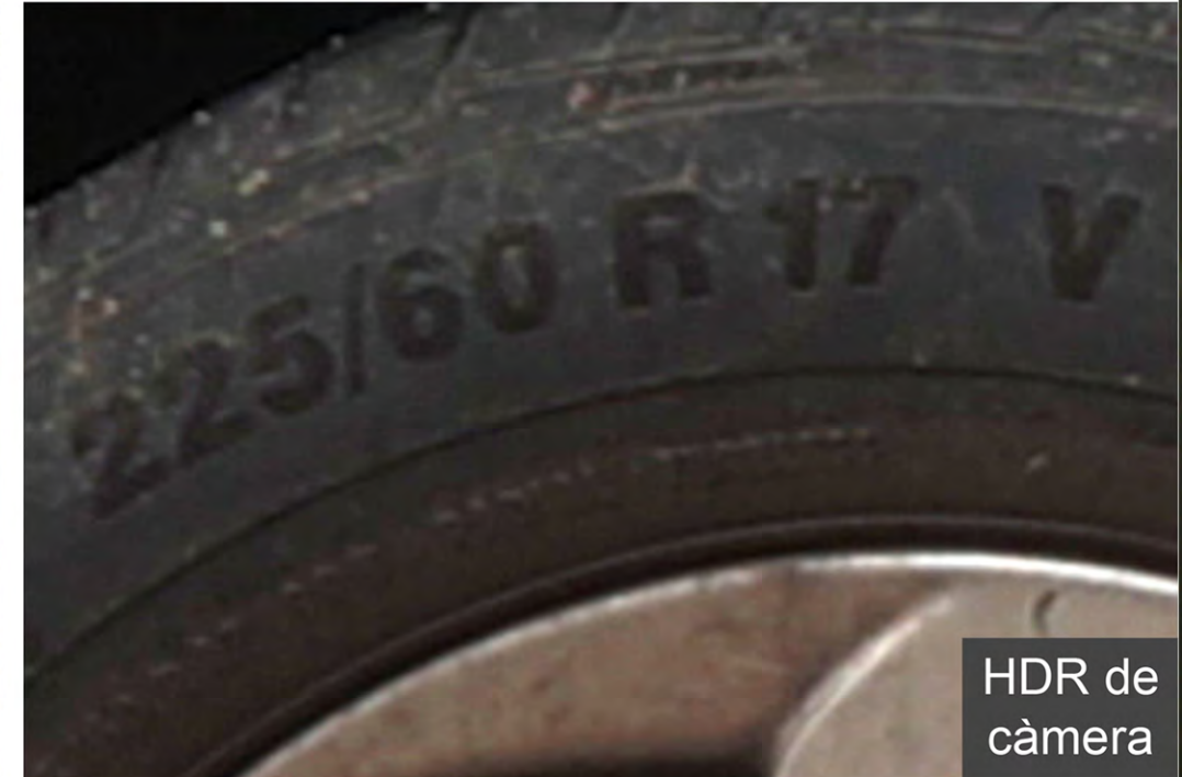
HDR de càmera